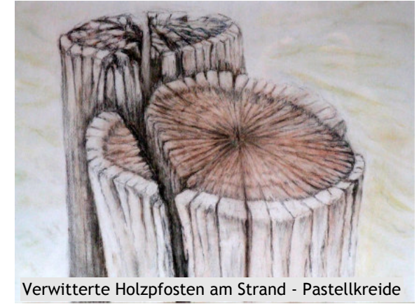
Verwitterte Holzpfosten am Strand - Pastellkreide