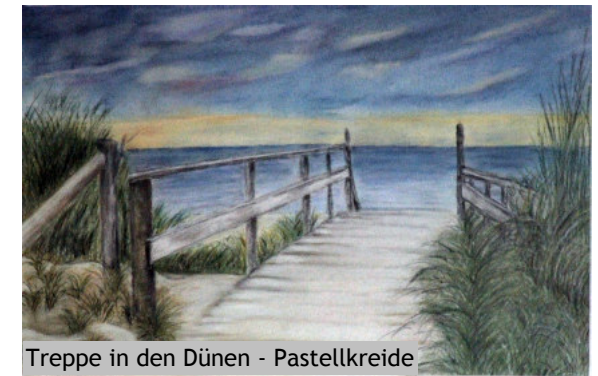
Treppe in den Dünen - Pastellkreide