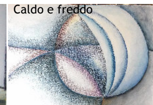
Caldo e freddo

Bevorzugte Techniken: Kohlezeichnungen, Silberstift, Grafit, Ölpastell, Tempera, Pastellkreide, Aquarell und Aquarellstifte Bevorzugte Motive: Abstraktion, maritime Impressionen, Weinbau