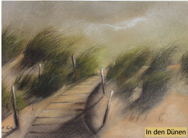
In den Dünen