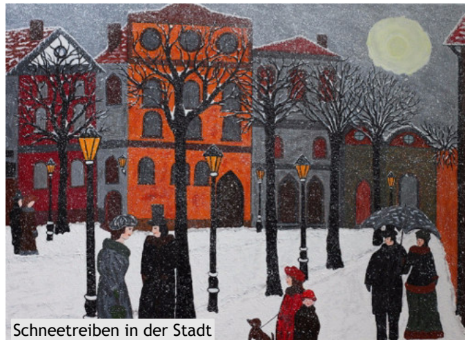
Schneetreiben in der Stadt

Nach der aktiven Zeit im Berufsleben suchte ich neue Herausforderungen. Das Interesse für Aquarell- und Acrylmalerei wurde geweckt. Ich war von Beginn an von den Werken des Expressionismus fasziniert, was sich in meinen Gemälden widerspiegelt.