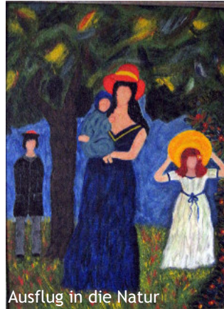
Ausflug in die Natur

Nach der aktiven Zeit im Berufsleben suchte ich neue Herausforderungen. Das Interesse für Aquarell- und Acrylmalerei wurde geweckt. Ich war von Beginn an von den Werken des Expressionismus fasziniert, was sich in meinen Gemälden widerspiegelt.