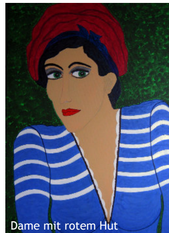
Dame mit rotem Hut

Es geht mir nicht um eine wirklichkeitsgetreue Wiedergabe von Beobachtungen und Eindrücken, sondern um den subjektiven und künstlerischen Ausdruck dessen, was mich während des Entstehungsprozesses meiner Werke bewegt.