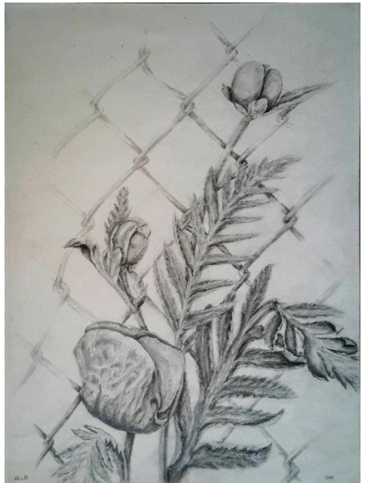
Mohn, Bleistift 1989 Größe 30 x 40 cm