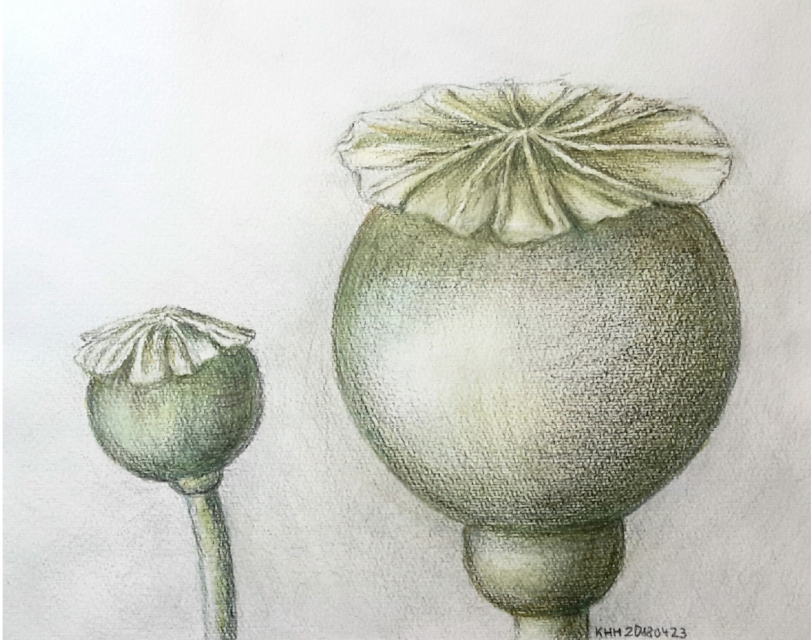
Mohnkapseln, Aquarellstifte 2018 Größe 27 x 22 cm

Das war ein Rückblick auf die Anfänge des Projekts. Nun kann es sein, dass ich ein altes Bild überarbeite oder auch kopiere, bzw. interpretiere. Immer neue Sichtweisen treten auf. Ich verwende alle Techniken und kombiniere sie. Manchmal ist es nur eine Skizze, dann eine sorgfältige Ausarbeitung. Pflanzen finde ich immer wieder im Garten der Fantasie. Der Mohn hat es mir angetan, immer wieder neue Sichtweisen sind hier möglich.