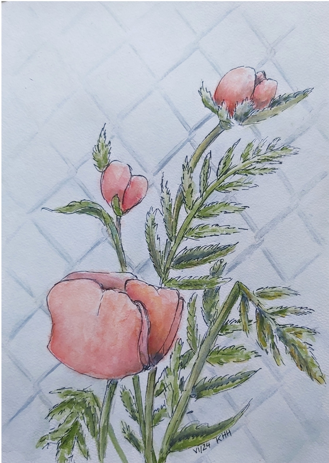
Mohn, Aquarellmischtechniken Juni 2024 Größe 21 x 30 cm

Die Umsetzung des alten Bildes von 1989 bringt durch die Farbigkeit und Neuinterpretation neue Sichtweisen. Bei einer Bleistiftzeichnung können Details genauer ausgearbeitet werden als mit der Farbe. Das gleiche Objekt, anderes Material, trotzdem die gleiche Perspektive, schon ist die Stimmung und die Sichtweise geändert.